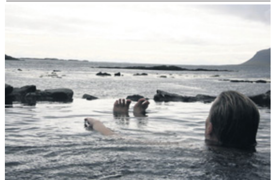
Hellulaug – náttúrubað rétt við Flókalund.