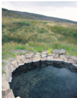
Gvendarlaug í Bjarnarfirði

Vatnavinir Vestfjarða ætla ekki aðeins að hvetja fólk til að nýta náttúruaugarnar á Vestfjörðum heldur ætla hópurinn að þróa hágæða heilsuferðahjónustu með