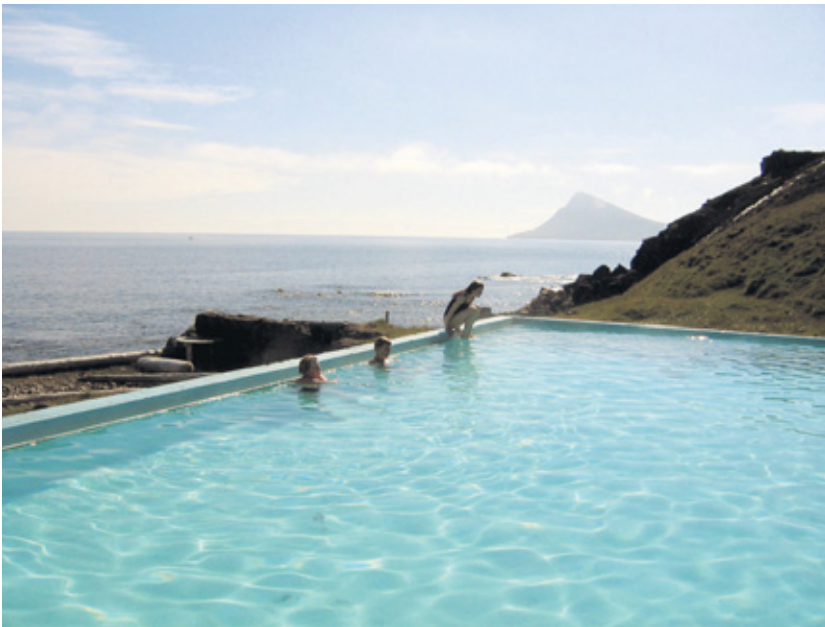
Krossneslaug við Norðurfjörð á Ströndum.