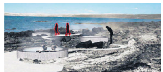
Skissa af sjávarböðum við Reykjanes.